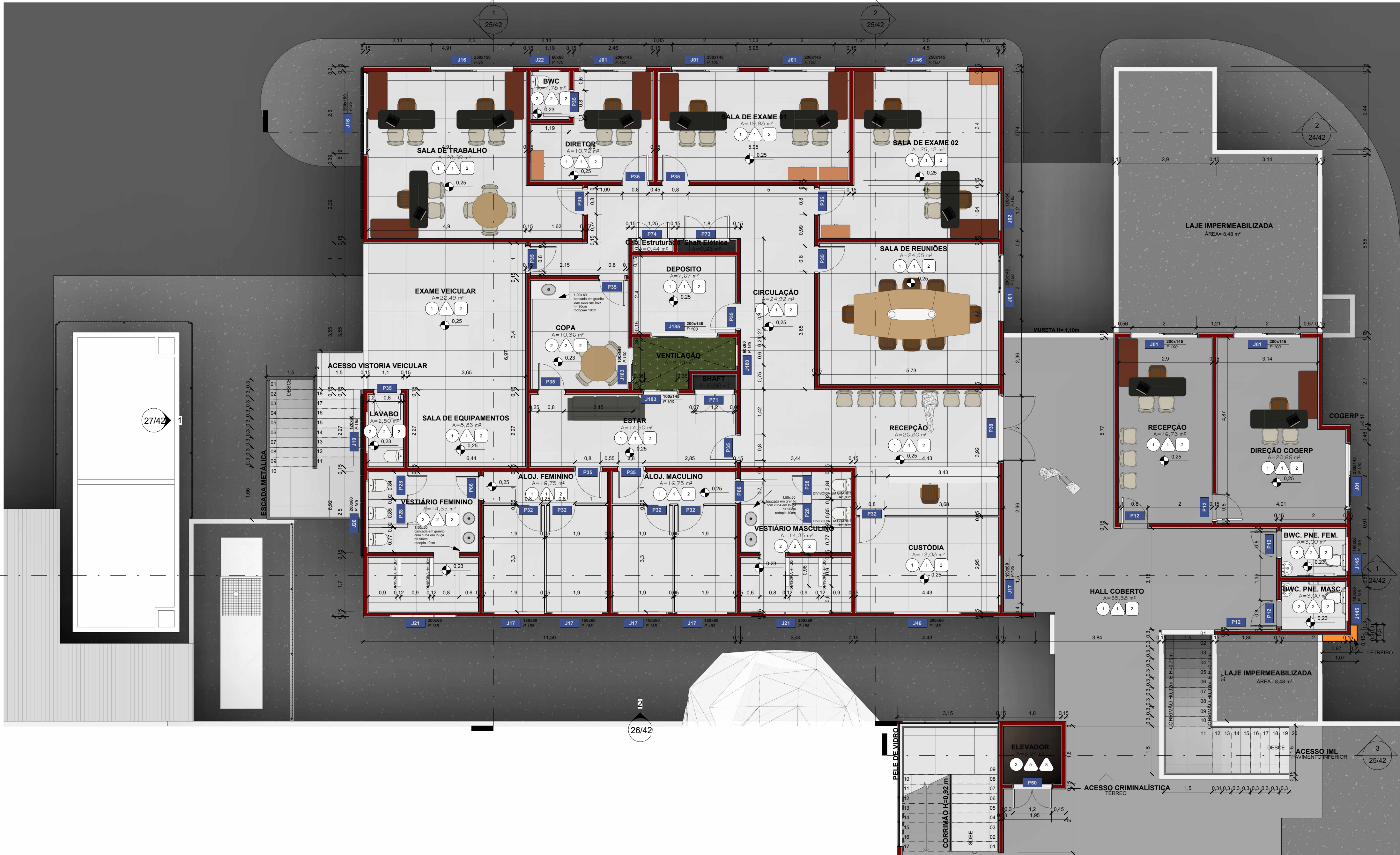
TÉRREO - COGERP ESCALA 1 : 75